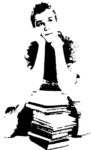
ПОРТРЕТ 2. «ВЕЧНЫЙ УЧЕНИК»

Не рекомендуется планировать получение высшего образования и приводить в пример успехи одноклассников.